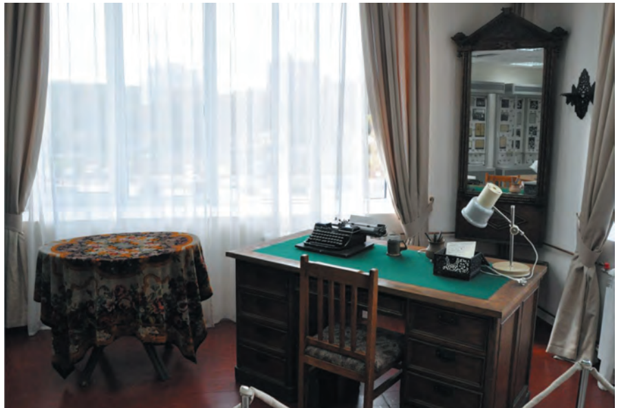
Мемориальный кабинет И. И. Молчанова-Сибирского в Иркутске. 2018 г.

Еще один научный метод разработки и создания экспозиции – ансамблевый. Он заключается в воссоздании на основе музейной и библиотечной коллекции пространственной среды, связанной с определенным историко-культурным процессом, явлением или событием. Подобный метод применяется, прежде всего, в мемориальных библиотеках, например в именных, расположенных в исторических зданиях, однако используется и в зданиях нового типа, как например, в новейшем здании Иркутской ОГОНБ им. И. И. Молчанова-Сибирского