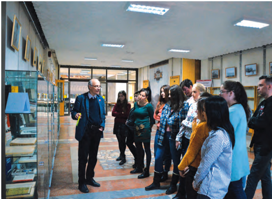
Студенты пятого курса исторического факультета Омского государственного педагогического университета на экскурсии по выставке Центра краеведческой информации Омской государственной областной научной библиотеки им. А. С. Пушкина

Встречи в Центре краеведческой информации не сводились только к устному