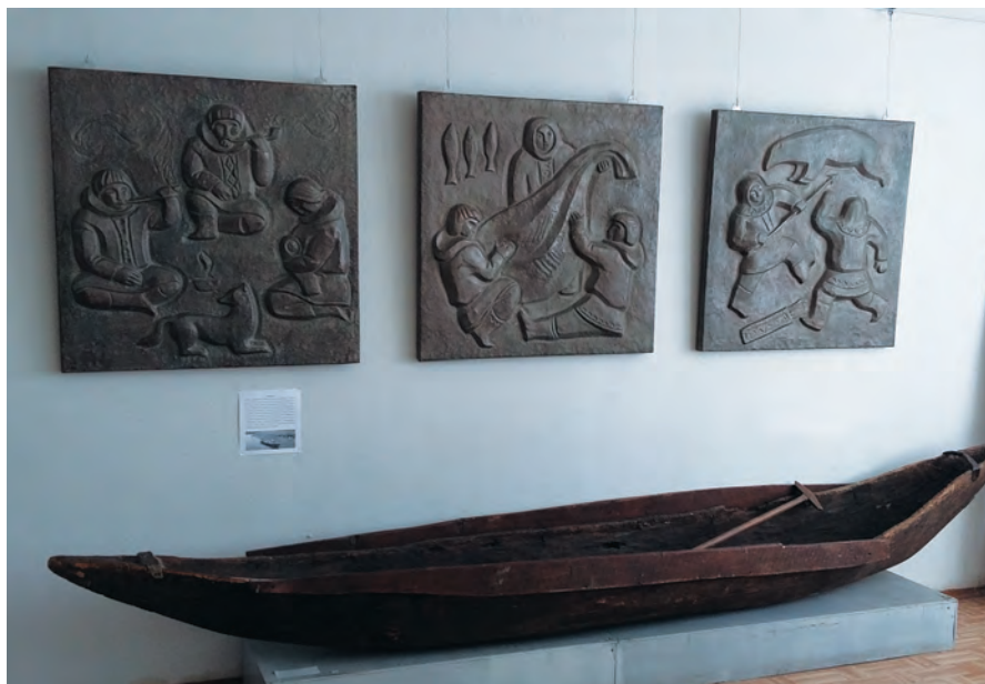
Начало этнографической экспозиции Музея археологии и этнографии Омского государственного университета имени Ф. М. Достоевского