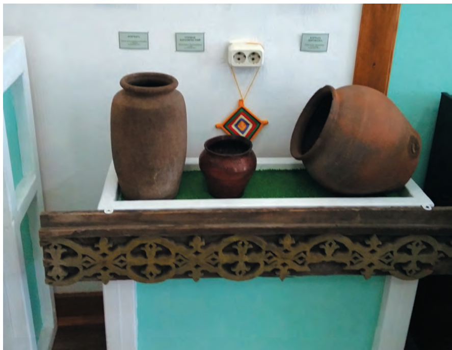
Этнографическая экспозиция Омского Музея просвещения. Коллекция глиняных горшков.

Основной фонд Музея просвещения посвящен народному образованию Омской области на протяжении многих десятилетий. Предметы этнографии народов Омского Прииртышья составляют около 100 ед. хр. и они не являются профильными для этого музея. Наиболее полные коллекции находятся в разделе этнографии русских – более 60 предметов. Это разнообразные мерные инструменты – складной аршин, механическая рулетка, компас в деревянном футляре XIX в., различные гири, весы, различная утварь и др. По этнографии дру-