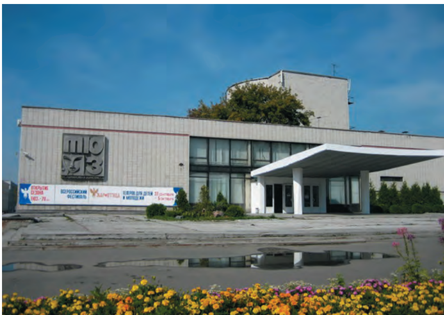
Здание омского ТЮЗа (построено в 1967 г.). Пр. Маркса, 46

В 1944 г. коллектив театра воссоединился. Ему вернули старое помещение на Партизанской. Несмотря на трудности, до