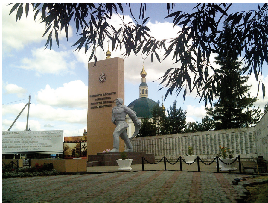
Илл. 8. Исилькуль. Мемориал славы воинам Великой Отечественной войны: памятник воинам-землякам, погибшим в годы Великой Отечественной войны, 2018 г.