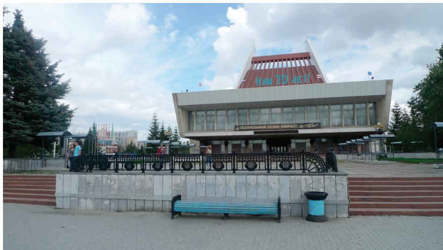
Илл. 13. Музыкальный театр, 2018 г.

в Советском районе – 1980 г. и др., 6 кинотеатров на 2,5 тыс. мест, музыкальный театр на 1200 мест (открылся в начале театрального сезона 1982 г.), зал органной и камерной музыки (первый концерт состоялся в декабре 1983 г.) 37 .