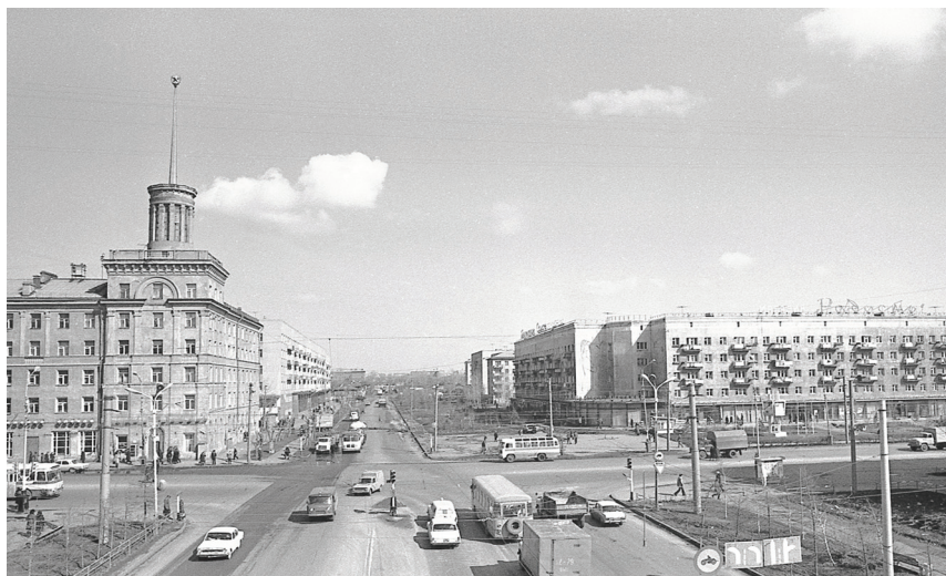
Илл. 9. Перекресток ул. Масленникова и пр. К. Маркса, 1970-е гг.

с вводом жилья сдавались объекты соцкультбыта (школы, детские сады, кинотеатры и пр.). Несмотря на высокие темпы жилищного строительства в городе по-прежнему оставался высоким удельный вес жилого частного сектора, который хотя и был в основном вытеснен на окраины города, но кое-где сохранился и в центральных районах. В 1985 г. удельный вес жилого частного сектора составлял 17,3% от общегородской застройки, или 210 тыс. кв. м 22 . Культурный ландшафт города страдал незавершенностью, серо-бетонной плоскостью и невыразительностью своих форм, хотя несколько и вырос вертикально. Однако появление значительного числа крупных социально значимых объектов и усиление всех видов коммуникационных связей придали городскому ландшафту большую связанность и целостность восприятия.