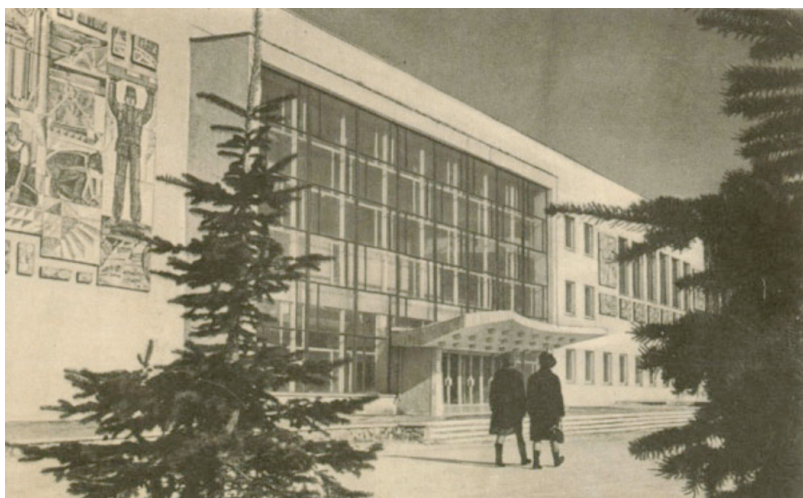
Илл. 6. Дворец культуры «Строитель». Источник: Архитектура Новосибирска. – Архитектурно-строительный справочник. – URL: http://nsk.novosibdom.ru/node/298 (дата обращения: 25.09.2018)

Общественные здания, построенные в 1950–1980-е гг., формировали центры новых планировочных районов. Здания, как правило, строились как полифункциональные. В композиционном решении сооружений подчеркивалась несущая основа, использование простых геометрических объемов, сочетание фактур, включение элементов природного ландшафта. Пространство общественных зданий «сливалось» с пространством города за счет больших остекленных площадей, «выноса» во вне части объема зданий. В данный период было распространено тиражирование типовых проектов, даже при строительстве крупных общественных зданий 8 .