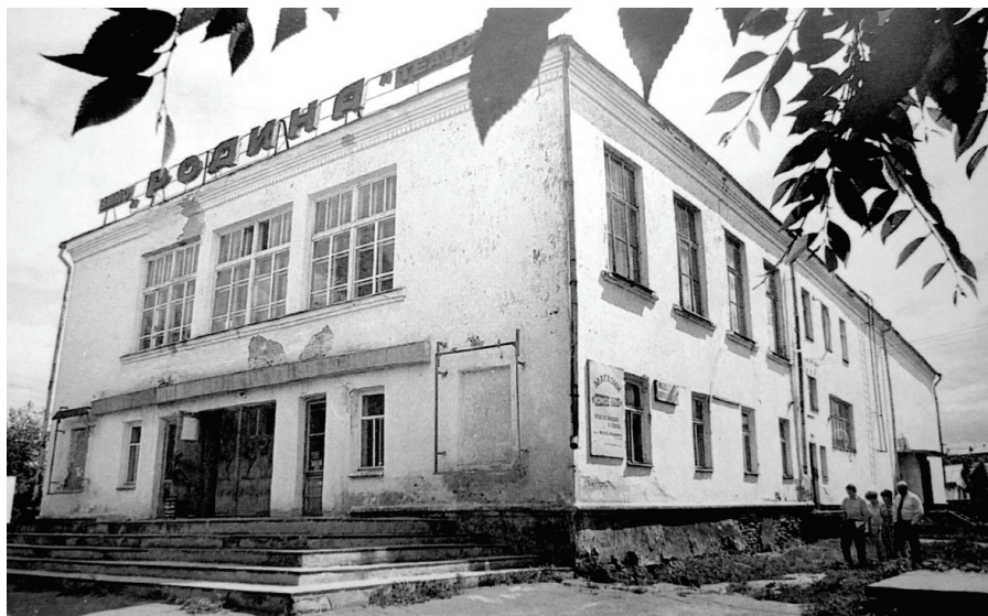
Илл. 6. Тара. Кинотеатр «Родина». Съемки 60-х годов XX в.

Кинообслуживанию, работе СМИ в городе уделялось особое внимание. 8 июля 1960 г. началось строительство широкоэкранного кинотеатра, рассчитанного на 500 мест, закончившееся 10 августа 1963 г. Кинотеатр в Таре стал называться «Родина». Он был возведен на пересечении улиц Ленина и Советской 26 . В Таре работал детский кинотеатр.