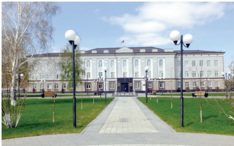
Илл. 3. Ишим. Административное здание, ул. Гагарина, 67, 2012 г.

Ранний и поздний периоды советской эпохи отражены в ряде административных и функциональных зданий. В стиле модерн было сооружено здание железнодорожного вокзала. Советский стиль, ориентированный на ордерные композиции в традициях исторического зодчества характерен для административного здания на ул. Гагарина, 67 (1955 г.). Три здания Ишима начала XX в. отвечают стилю конструктивизма: «Дом обороны (1931 г.), здание клуба имени Ильича (1926 г.), содержащее парадный вестибюль и зрительный зал; кинотеатр им. В.В. Блюхера (1930 г.)» 5 .