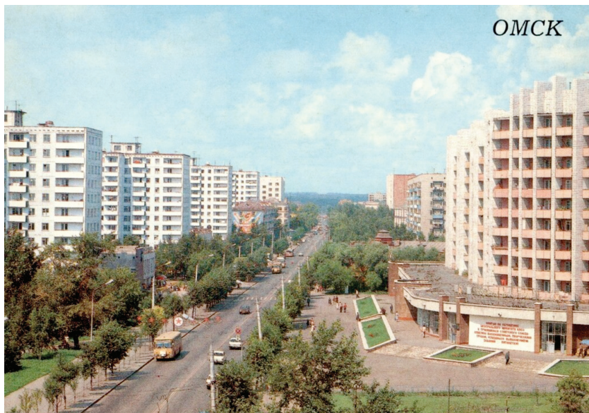
Илл. 10. Ул. Красный путь, 1988 г.

мических маркеров можно развернуто представить на примере советского Омска. Омск, как и многие из российских городов, имел богатое историческое прошлое и вполне устойчивую топонимическую систему на 1917 г. отражающую «культурный ландшафт дореволюционного города». В результате революционных преобразований (1917–1920) эта система подверглась сначала критике, а затем пересмотру.