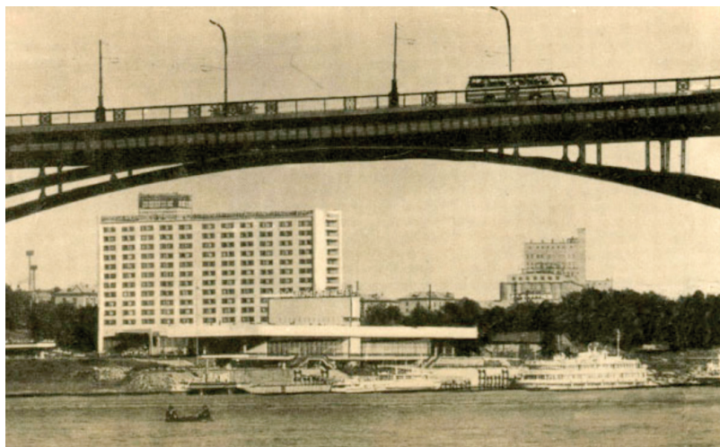
Илл. 1. Речной Вокзал и Октябрьский коммунальный мост.

Но одновременно с этим город рос, шли агломерационные процессы. Появлялись новые поселки вблизи города. Возводились жилые районы вокруг вновь созданных научных центров, промышленных предприятий, аэропортов. Это город Обь – поселок аэропорта Толмачево, поселок ОбьГЭС, наукограды Академгородок, Краснообск, Кольцово.