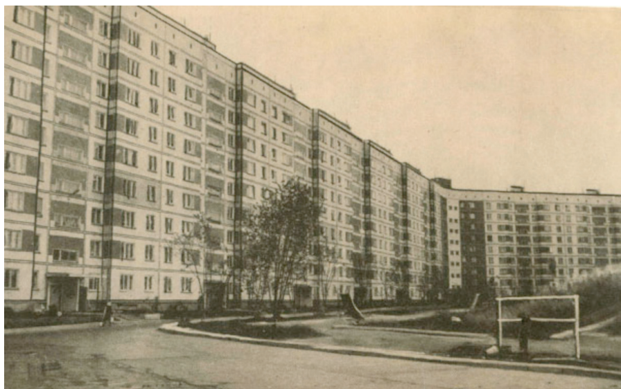
Илл. 4. Жилмассив Снегири.