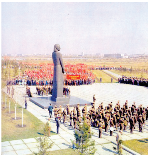
Илл. 2. Празднование Дня Победы в Омске, Парк Победы (середина 1970-х гг.).

омичей и новосибирцев приковывал военный парад на Красной площади в столице нашей Родины – городе-герое Москве. По телевидению демонстрировались художественные фильмы о войне – «Щит и меч», «Брестская крепость», «17 мгновений весны», «Они сражались за Родину», «Молодая гвардия», «Два бойца», «Летят журавли», «Освобождение» и другие. Самыми любимыми фильмами о войне среди всех возрастов являлись фильмы «А зори здесь тихие» и «В бой идут одни старики». Популярность этих кинолент объясняется простотой и трогательностью героев фильмов, которые стали символами верности долгу, нестигаемости и настоящего патриотизма. Песнями о войне, которые омичи и новосибирцы любили слушать на концертах и исполняли сами во время застолий и празднований, стали песни «Вставай, страна огромная», «Хотят ли русские войны», «Темная ночь», «Враги сожгли родную хату», «Журавли», «Катюша», «Землянка», «На безымянной высоте», «Песенка фронтового шофера», «Синий платочек», «Смуглянка», «Десятый наш десантный батальон» и другие. Самой популярной являлась песня Давида Тухманова и Владимира Харитонova «День Победы», написанная в 1975 г. к 30-летию Победы.