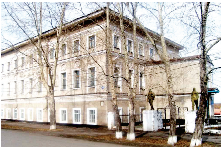
Илл. 7. Тара. Сменная общеобразовательная школа. Бывший Дом учителя.

Так, газета «Ленинский путь» от 2 июня 1960 г. сообщает, что «в ленинском зале школы № 2 им. Ф.Э. Держинского мимо памятника Ленину торжественным маршем прошли колонны пионеров, состоялось выступление гимнастов. Хорошо прошел праздник в Загородной роще. Состоялась торжественная линейка. Были подведены итоги экспедиции «Заветам Ленина верны» – рапортовали пионеры. Состоялся концерт городской музыкальной школы». Сочетание закрытых мест проведения мероприятий и на воздухе придавало им особую торжественность.