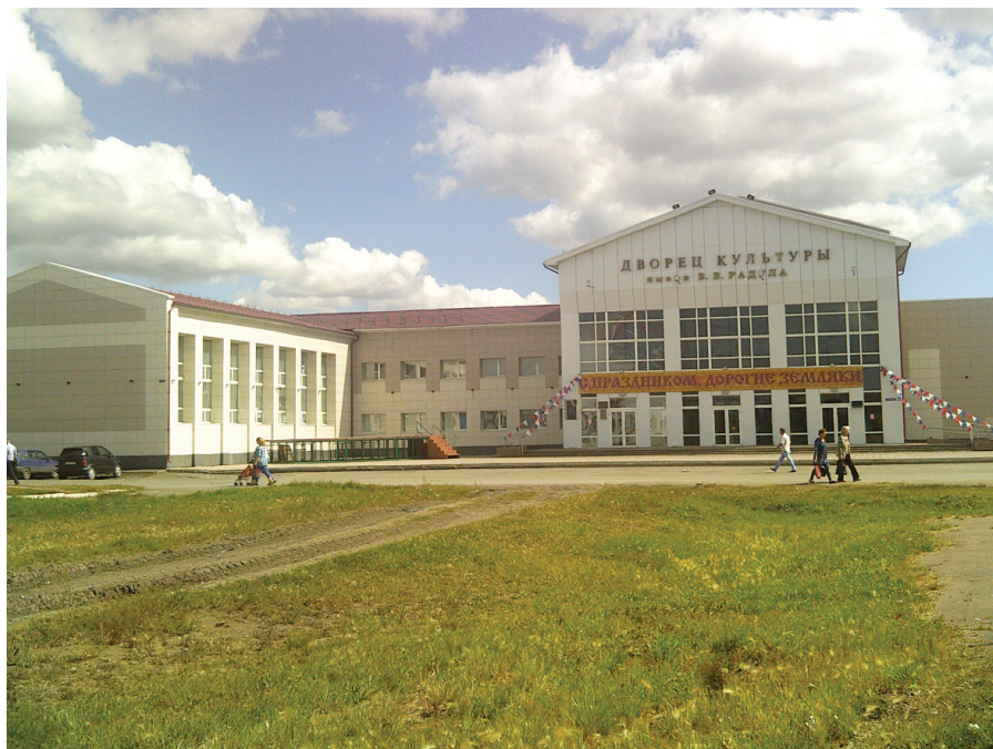
Илл. 10. Искилькуль. Дворец культуры им. В.В. Радула, 2018 г.

В период уборки урожая начиналась особая активизация деятельности культурпросветучреждений: так в 1967 году, по данным газеты «Знамя», было проведено 320 лекций, 32 тематических вечера, действовало 114 кружков художественной самодеятельности, было поставлено 33 концерта, 70 спектаклей и 90 концертов народного театра, была организована выставка самодеятельных художников.