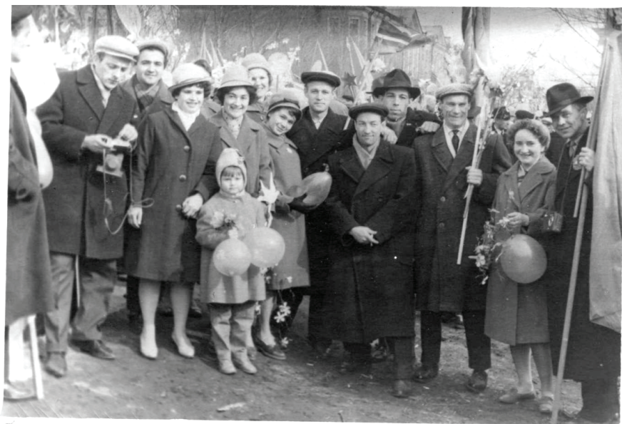
Илл. 4. Первомайская демонстрация. Омск, конец 1960-х гг.

раздавали тюльпаны жителям городка, поздравляя их с Первомаем. Вечером на крыльце главного корпуса НГУ выступали представители руководства университета и устраивался большой праздничный концерт при огромном стечении студентов и всех жителей Академгородка. Звучали песни на разных языках, студенты скандировали: «Когда мы едины, мы непобедимы!». В темноте на клумбе разжигался большой костер, являвшийся символической точкой притяжения праздника. Возле него представители разных стран танцевали и общались между собой всю ночь. А утром все вместе шли на демонстрацию. Демонстрация в Академгородке проходила по Морскому проспекту от Института археологии и этнографии СО РАН до Дома ученых, где на крыльце проходил торжественный митинг и звучали песни советских композиторов.