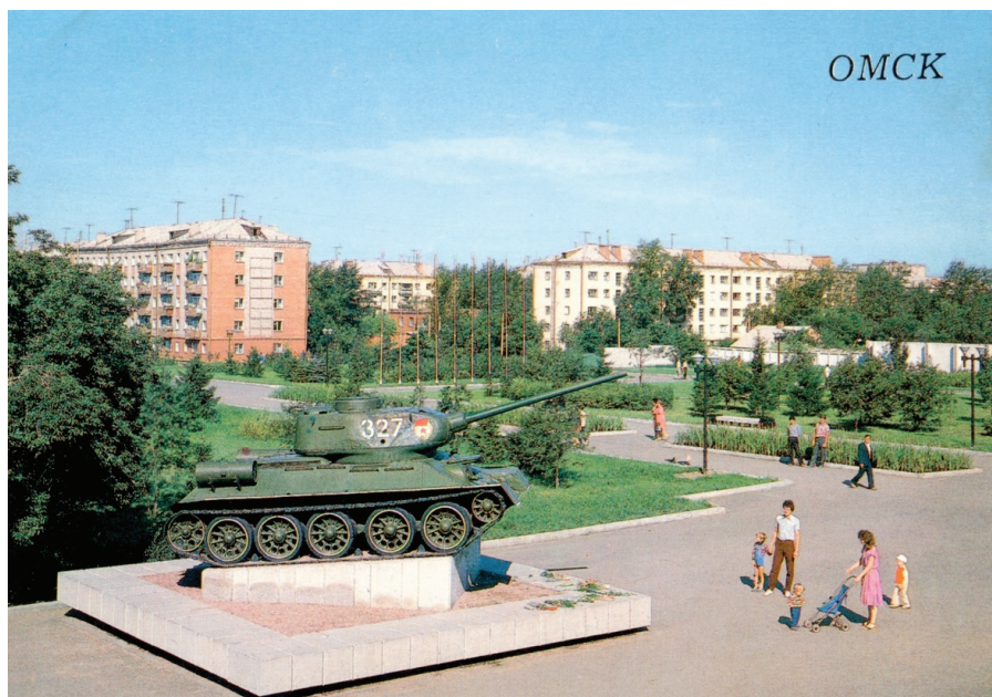
Илл. 12. Бульвар Победы. Мемориал «Слава Героям», танк Т 34-85.

ландшафта – мостов. Все они получили символически и идеологически выверенные наименования. Мост через реку Омь в створе улицы Ленина, законченный строительством к 50-й годовщине Великой Октябрьской социалистической революции получил наименование «Юбилейный», мост через реку Омь в створе ул. Гагарина и проспекта Маркса стал «Комсомольским». Мост через реку Омь в створе ул. Б. Хмельницкого и 2-й Восточной был назван «Октябрьским» (хотя в просторечье именовался «Горбатым»). Мост через реку Иртыш в створе ул. Масленникова – Ленинградской площади получил имя «Ленинградского» 24 .