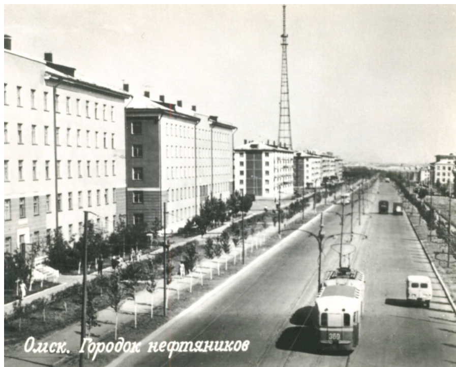
Илл. 8. Городок Нефтяников, 1966 г.

Кордным. Телевизионный – Чередовыми и т. д. Каждый «системо-образующий» завод выстраивал свою собственную инфраструктуру: жилищную, образовательную, культурную, спортивную. Так, в Парке культуры и отдыха им. 30-летия ВЛКСМ (Октябрьский район) негласное соревнование вели два наиболее мощных оборонных завода: авиационный завод и моторостроительный завод им. Баранова. Если один из них строил стадион, каток или бассейн, то второй, делал то же самое. В результате парк быстро редел, теряя свое зеленое убранство, хотя и наполнялся важными инфраструктурными сооружениями.