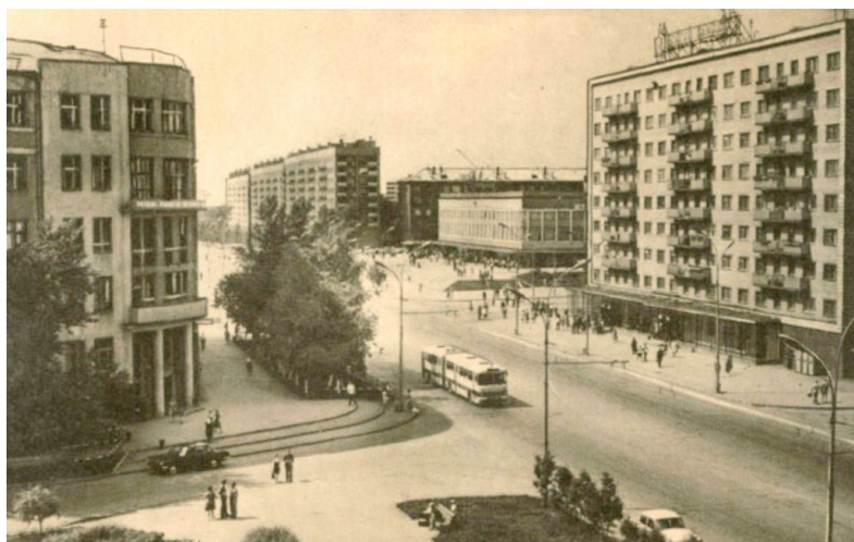
Илл. 2. Вокзальная магистраль.