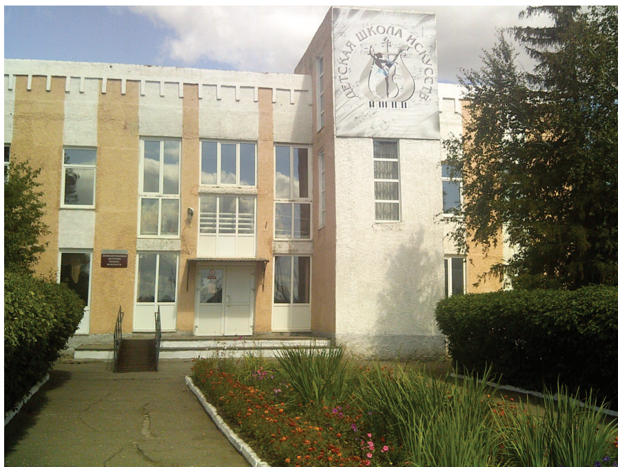
Илл. 9. Исилькуль. Детская школа искусств, 2018 г.

В библиотеках использовались многообразные формы активизации читателей, привлечения их к строительству социализма. Мероприятия библиотек носили массовый характер и были приурочены к датам советского календаря. Приведем пример работы Исилькульских библиотек в 1971 г. Они принимали участие «в смотре 50-летия Советской власти, Всесоюзном конкурсе «Дорогой отцов». За 9 месяцев организовано 280 книжных выставок, проведено 242 обзора литературы, 1100 громких чтот и бесед, 92 литературных вечера и конференции 54 . В 1970-х годах деятельность Исилькульских библиотек подчинялась также работе партийных съездов. Библиотеки – к XXIV съезду КПСС; картотеки «От съезда – к съезду, плакаты «Лозунги по пропаганде партийного съезда» 55 .