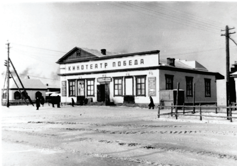
Илл. 11. Исилькуль. Кинотеатр «Победа», 1956 г.

монстрировалось в кинотеатре «Победа», в клубе железнодорожников и в клубе им. В.И. Ленина. В 50-е годы XX в. в Исилькуле, как и в других райцентрах по распоряжению Омского облисполкома, появился летний кинотеатр с количеством мест в 320 человек 63 . В 1961 году в Исилькуле открылся детский кинотеатр.