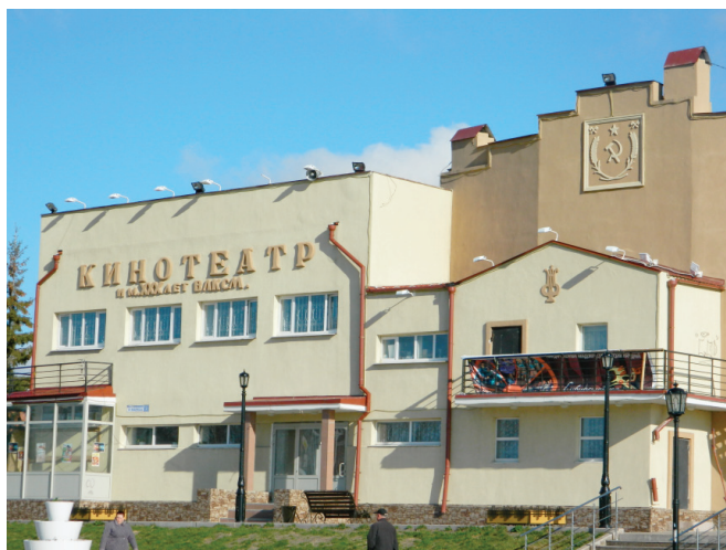
Илл. 1. Ишим. Кинотеатр им. 30 лет ВЛКСМ, 2013 г.