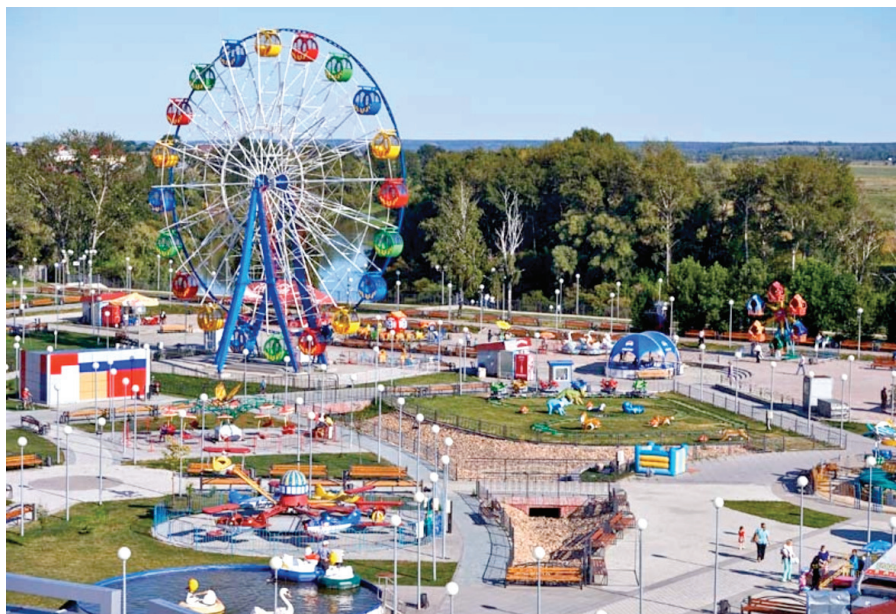
Илл. 4. Ишим. Городской парк культуры, 2015 г.

редко встречаются в средних и малых городах Западной Сибири и нуждаются в государственной охране. Позднее Ишим получил статус исторического города.