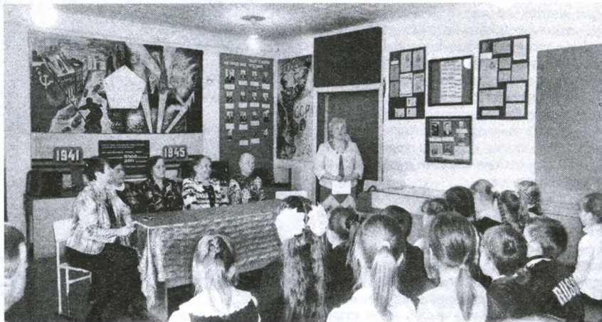
Занятие для детей в зале боевой славы

Важное значение в работе музея имеет работа по патриотическому воспитанию подрастающего поколения. В рамках реали-