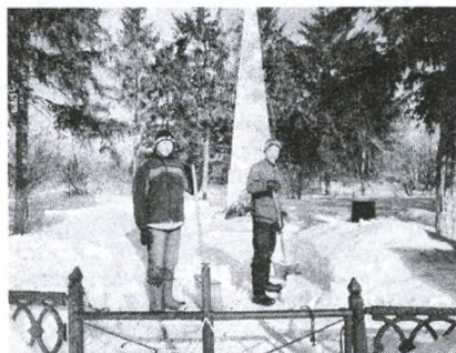
Памятник землякам, погибшим в Великой Отечественной войне, в с. Уленкуль

В Уленкульской школе имеется еще один музей – Музей истории школы. Находится он в отдельном кабинете. В нем собран богатый материал, отражающий становление и развитие школы начиная с 1924 года. Множество экспонатов, документов и фотографий хранятся в этом музее. Большой материал собран и о жителях самого села. Учащиеся приносят в музей письма с фронта своих родных, документы, грамоты, воспоминания ветеранов Великой Отечественной войны и ветеранов труда. Все это наглядно показывает, как значительна жизнь каждого ученика, учившегося в школе, и как дорого каждое событие, происходящее в селе.