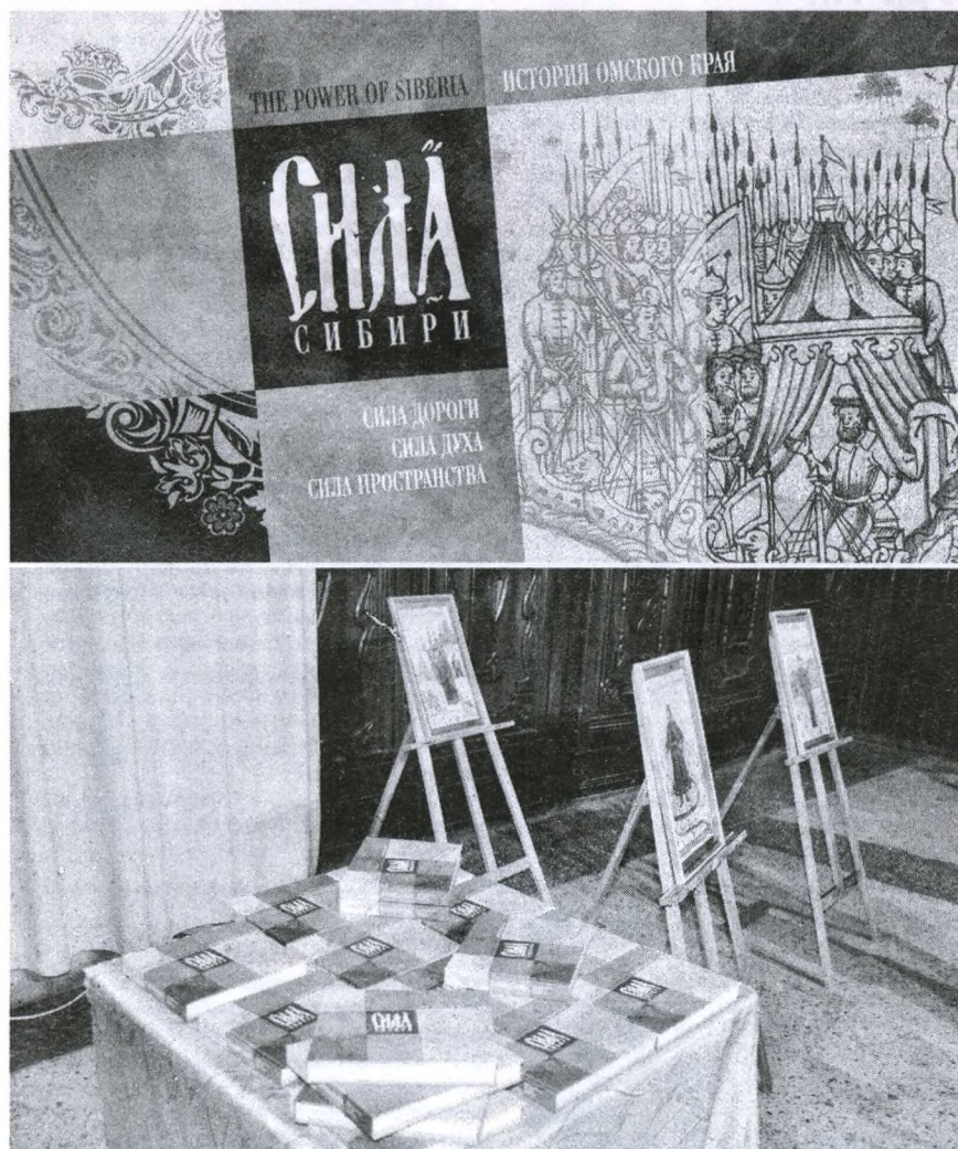
Презентация издания в г. Тара. 2 декабря 2016 г.

Существовавшее изначально отношение к Сибири как к особой территории, своеобразному российскому Эльдorado, сегодня ушло. На взгляд обывателя, Сибирь – это унылая провинция, где ничего не происходит и никогда не происходило. Опровергнуть этот стереотип призвана недавно увидевшая свет подарочная научно-популярная книга-альбом «Сила Сибири. История Омского края». Ее авторами стали омские историки, краеведы, философы и литераторы. Издание этой книги Тарской епархией на средства президентского гранта стало первой попыткой окинуть взглядом необозримую панораму, которой прежде никто не уделял особого внимания. И на понятном любому языку символов и художественных образов ответить на вопрос о месте Сибири и города Омска в стране и мире, в прошлом и настоящем.