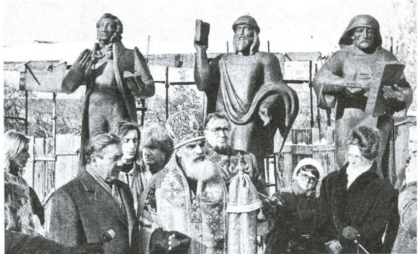
Освящение скульптур для фасада библиотеки митрополитом Омским и Тарским Феодосием. 1993 г.

В год 300-летия Омска на сайте библиотеки с января в свободном доступе представлен ежемесячный календарь наиболее примечательных событий из истории Омска в текущем месяце. О каждом факте читатели библиотеки могут узнать подробнее в электронном каталоге библиотеки, задав параметр «Хроника...». Введя данные этого календаря, можно узнать, какие источники