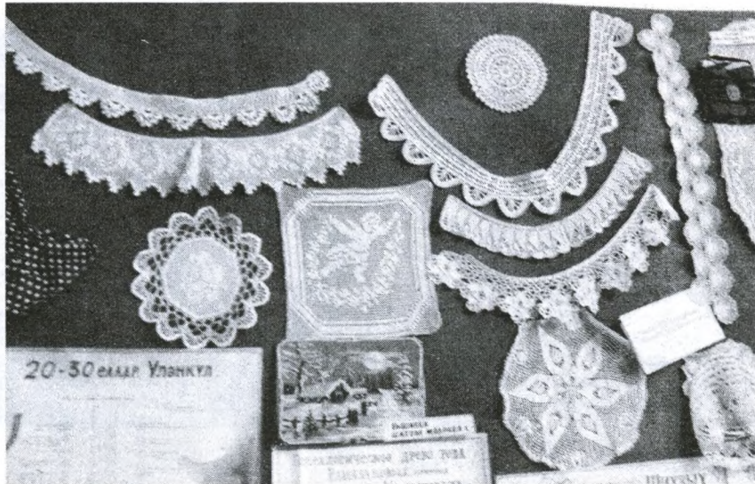
Краеведческий музей Уленкульской школы. Рукоделие местных мастериц

Краеведческий музей Уленкульской школы располагается всего в одной небольшой комнате, но богатству этнографической коллекции, находящейся в ней, могут позавидовать многие крупные музеи Западной Сибири и России. В музее числится более 200 предметов культуры и быта татар. Все предметы, находящиеся в музее, были