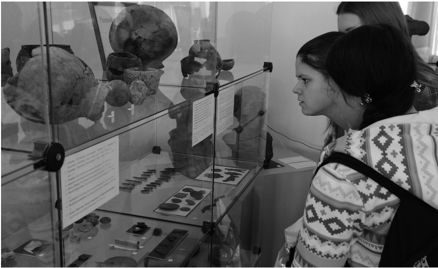
Студенты на открытии выставки «От древности до современности» Музея археологии и этнографии Омского государственного университета им. Ф. М. Достоевского. 17 ноября 2014 г.