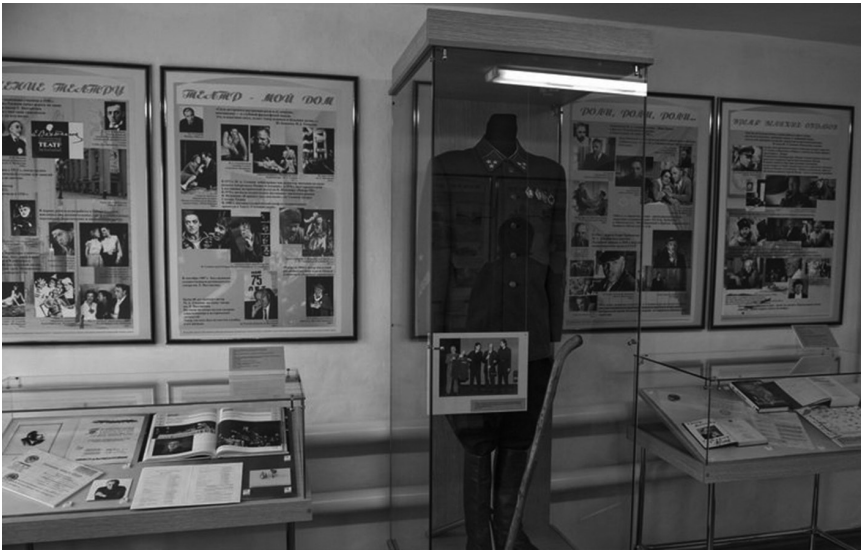
Экспозиция выставки в Доме-музее М. А. Ульянова. Тара, 26 июля 2014 г.

в 1944 г. М. А. Ульянов поехал учиться в студию Омского драматического театра.