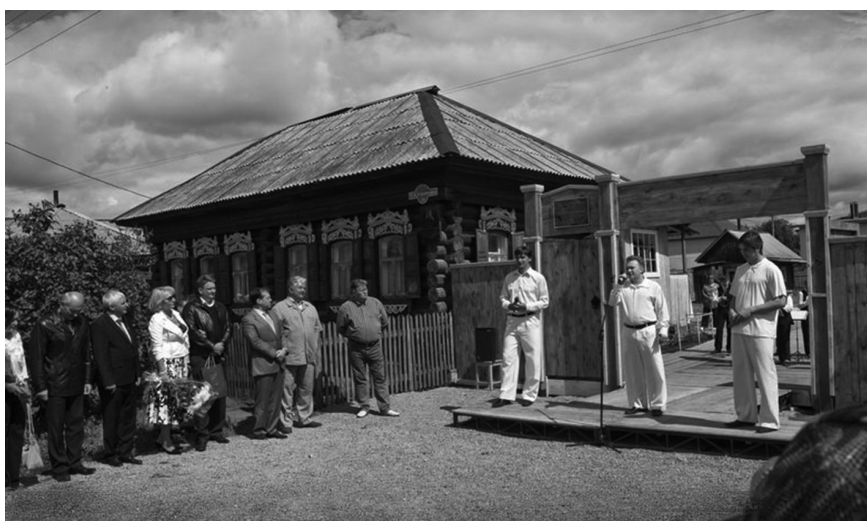
Открытие мемориального Дома-музея М. А. Ульянова. Тара, 26 июля 2014 г.