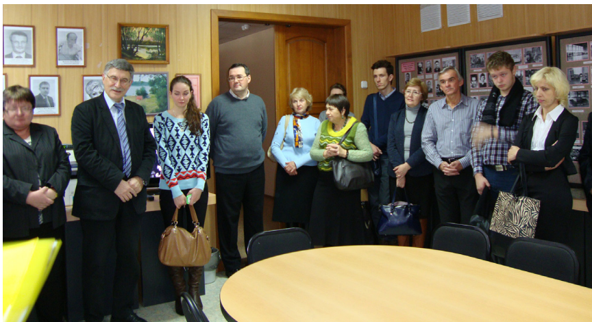
На открытии экспозиции «ОмГУ: 40 лет на службе высшего образования, науки и культуры» в Музее истории Омского государственного университета им. Ф. М. Достоевского. 22 октября 2014 г.

В 1975 г. в отдельной аудитории (рядом с основной экспозицией) была создана постоянно действующая выставка, повествующая о начальном периоде истории ОмГУ, о каждом факультете и разных видах (культурной, спортивной и т. д.) деятельности университета.