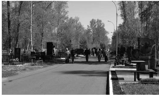
Центральная аллея Старо-Северного мемориального кладбища г. Омска. 9 мая 2014 г.

В условиях перестройки и обращения к новым формам трансляции исторической