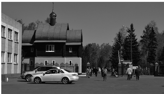
Площадка перед входом на Старо-Северное мемориальное кладбище г. Омска и храм святого Архангела Михаила. 9 мая 2014 г.