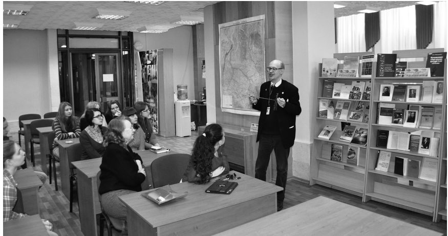
Экскурсия по книжно-иллюстративной выставке Центра краеведческой информации. 2014 г.