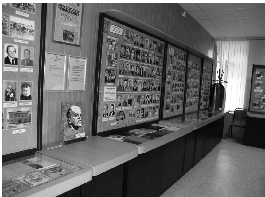
Часть экспозиции «ОмГУ: 40 лет на службе высшего образования, науки и культуры» в Музее истории Омского государственного университета им. Ф. М. Достоевского. 22 октября 2014 г.

Первые три витрины посвящены сюжетам открытия первого университета в г. Омске. Здесь показаны фотографии людей, причастных к появлению вуза в Омске, – первый ректорат, первый состав преподавателей, первые студенты, первый учебный корпус. Также можно проследить изменения в кадровом составе работников университета, например, показаны портреты заведующих библиотекой в разные годы, сотрудников бухгалтерии, архива и т. д. В девяти следу-